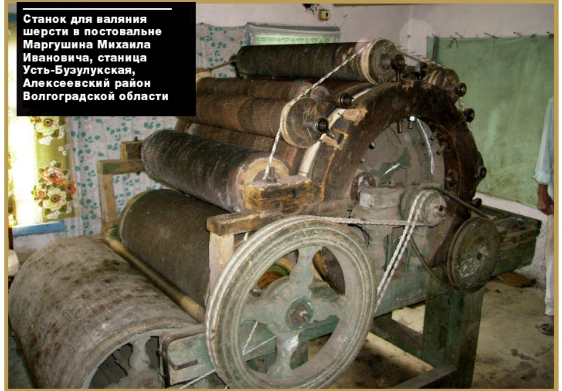
Станок для валяния шерсти в постовальне Маргушина Михаила Ивановича, станица Усть-Бузулукская, Алексеевский район Волгоградской области

Мастера-постовалы были почти в каждом селении, работали они, как правило, на заказ. В некоторых местах промысел был отхожим. В таком случае из волжских сел с 1 октября уходили постовалы в Донскую область и валяли там вплоть до Масляницы из шерсти заказчика валенки и полости. Обычно они объединялись в небольшие артели (по 3-4 человека). Постовальные мастерские устраивали в «низах» жилых домов или строили отдельные помещения. Оборудование постовальни очень простое: печь с вмазанным в нее котлом да широкая лавка, на которой валяли валенки или покрывала.