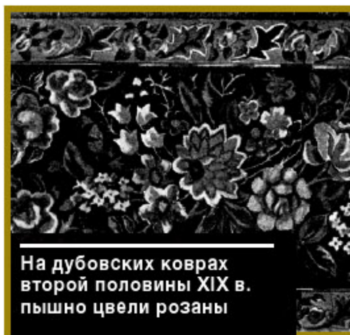
На дубовских коврах второй половины XIX в. пышно цвели розы

(по 10-15) привязывали к длинной палке (диаметром 5 см). Потянув на себя палку, можно было вывести вперед нужный пучок нитей заднего ряда основы.