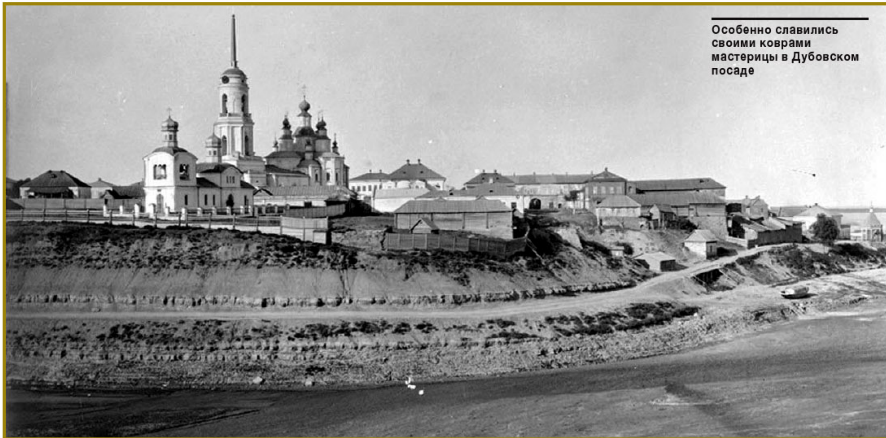
Особенно славились своими коврами мастерицы в Дубовском посаде