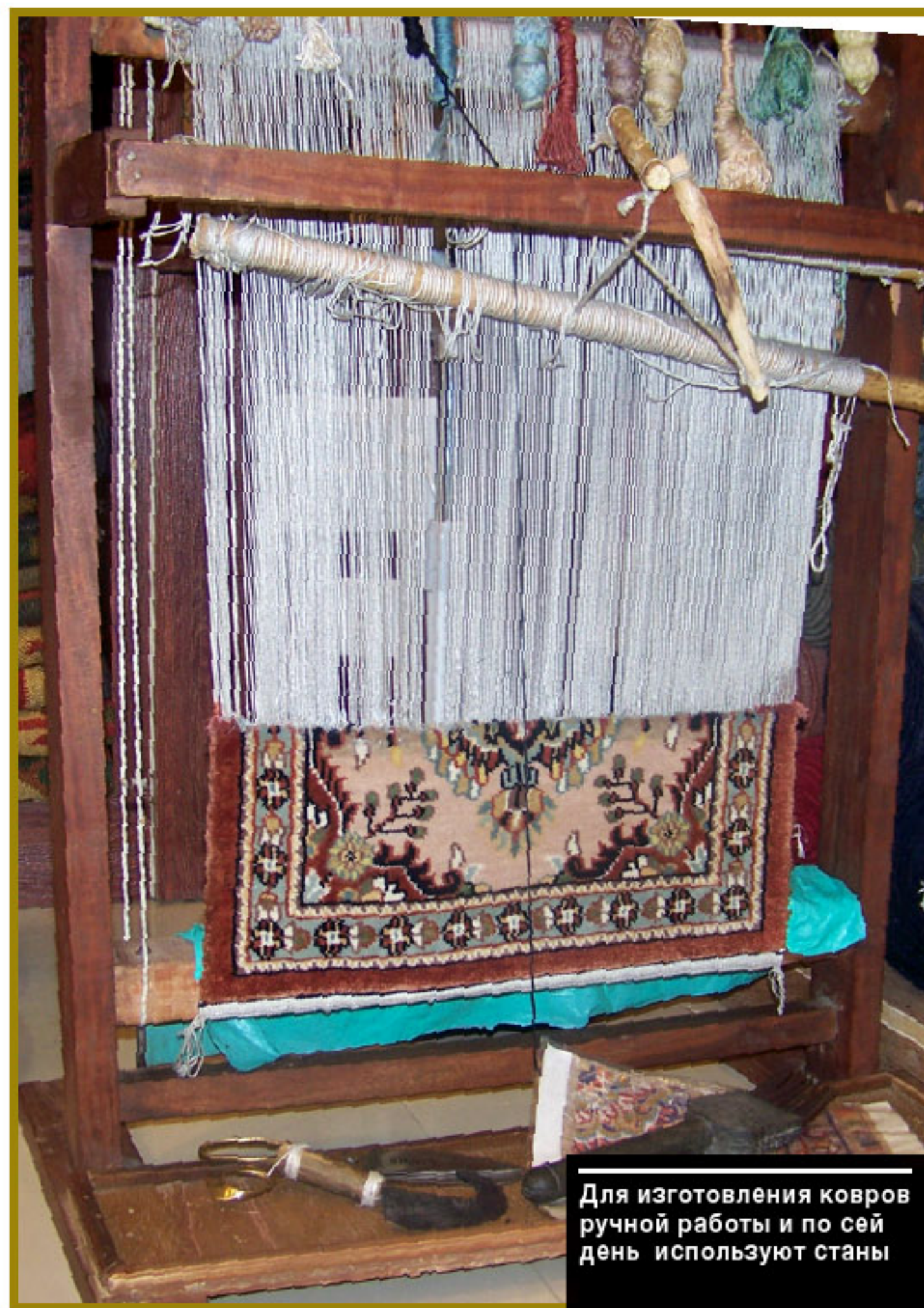
Для изготовления ковров ручной работы и по сей день используют станы

Техника тканья дубовских ковров заключалась в чередовании нитей утка с так называемыми стручками. Стручки нарезали из разноцветной пряжи. Каждый стручок пропускался между двух нитей основы (передней и задней) и туго завязывался узелком. Когда такими стручками была пройдена основа во всю ширину ковра, в зев пропускали челнок с толстой нитью, ссученной из коровьей шерсти. Прибивали нить утка деревянным гребнем. Изготовив 50-60 см ковра, мастерица выравнивала стручки ножницами и наворачивала готовый кусок на вал или просто перетягивала основу на навоях так, чтобы можно было продолжать работу дальше. Обычно завязыванием стручков занимались девочки 9-10 лет. Взрослая мастерица садилась в центре, а девочки-ученицы рас-