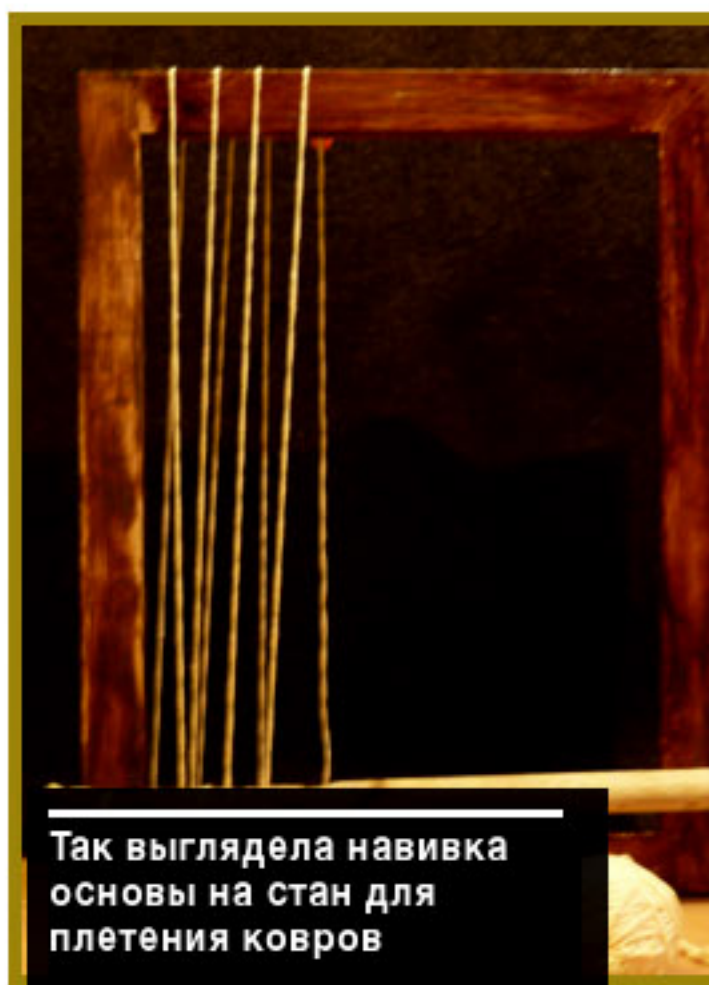
Так выглядела навивка основы на стан для плетения ковров

Для того, чтобы можно было менять положение передних и задних рядов основы, к задним нитям (то есть к тем, которые шли под линейкой) привязывали отдельные крепкие нитки длиной 10-15 см и выводили их наружу сквозь передние нити основы. Затем пучок этих нитей